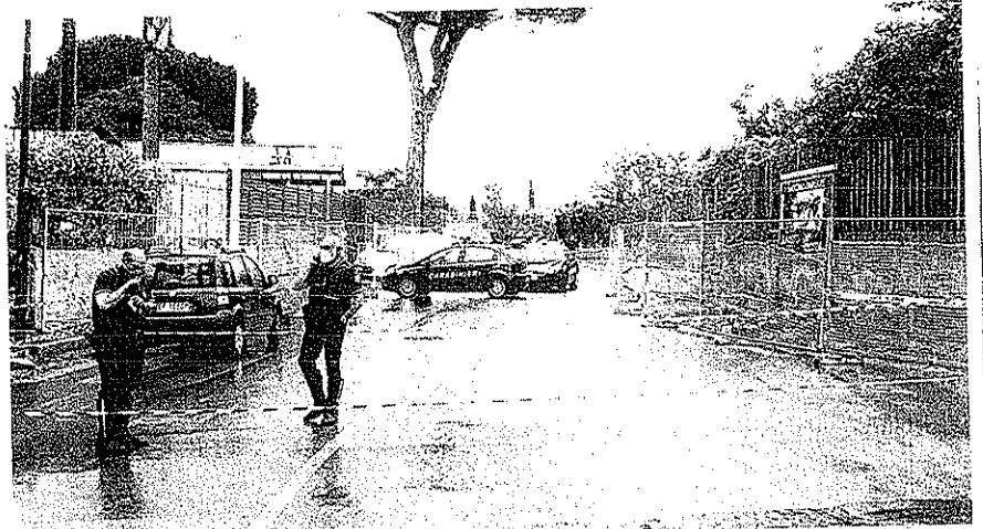
Il vigile urbano in servizio a San Giorgio a Cremano, originario di Ercolano, si è tolto la vita in via Siani a Portici. Si era vestito con la divisa di ordinanza per andare a lavorare