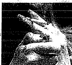
LA STRETTA Fumo vietato in città