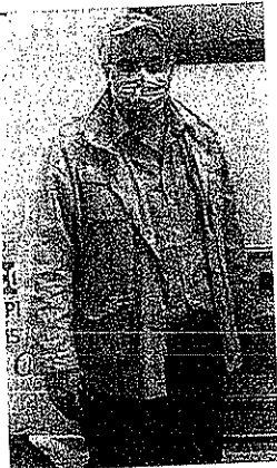
Il sindaco Ha disposto lo stop al fumo in aree pubbliche

San Giorgio a Cremano. Fase Due. A San Giorgio a Cremano scatta l'ordinanza antifumo su tutto il territorio pubblico fino al prossimo 31 maggio. In seguito a numerose segnalazioni da parte di cittadini e della stessa polizia municipale di comportamenti non conformi all'uso obbligatorio delle mascherine in strada e nei parchi, da parte di persone che per fumare abbassano o tolgono il dispositivo di protezione, il Sindaco Giorgio Zinno ha firmato un'ordinanza (la numero 28 dell'8 maggio 2020) che dispone il divieto di fumo sul suolo pubblico cittadino. Una decisione presa nel rispetto di quanto stabilito dall'ordinanza del presidente della Giunta regionale Vincenzo De Luca, che impone