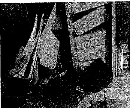
GUARDIA DI FINANZA Le azioni ispettive del comando di Portici

e in particolare nella città della Reggia sono stati scoperti tre giovani a lavorare totalmente "in nero", sconosciuti agli enti previdenziali. Dunque questo è il risultato dell'ultimo controllo a tappeto, ma non è l'unico effettuato negli ultimi tempi dalla guardia di finanza del comando di Portici, e in particolare da gennaio fino a oggi sono stati ben tredici gli interventi destinati a sgominare il business delle "assunzioni" fuorilegge. A finire nel mirino della guardia di finanza specialmente bar, birrerie, pub, ristoranti, piscine e attività ricettive. Proprio questi imprenditori secondo gli uomini in divisa sono coloro che principalmente