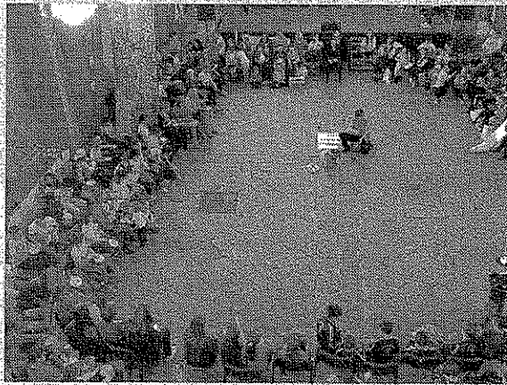
Il drum circle

SAN GIORGIO A CREMANO (gr) - Arriva in Villa Falanga lo straordinario "Drum Circle": si tratta di un'iniziativa di integrazione e condivisione che verrà messa in scena al ritmo di un'orchestra di tamburi. Striamo parlando del "cerchio di tamburi" che si realizzerà nell'ambito di "Estate in Villa 2018", il campo dedicato ai ragazzi diversamente abili di San Giorgio a Cremano che si svolge fino al 15 settembre. Il Drum Circle inizierà oggi, alle 18, con l'esperta musicoterapeuta Grazia Di Luca ed è aperto a tutti i bambini, adolescenti e adulti, che vorranno suonare in una grande, unica orchestra ritmica all'aperto, insieme ai 26 ragazzi tra i 6 e i 18 anni che