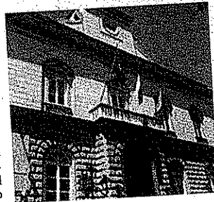
Il Comune di San Giorgio

degli enti del Terzo Settore e dei cittadini che vorranno sapere di più sulle opportunità che il progetto