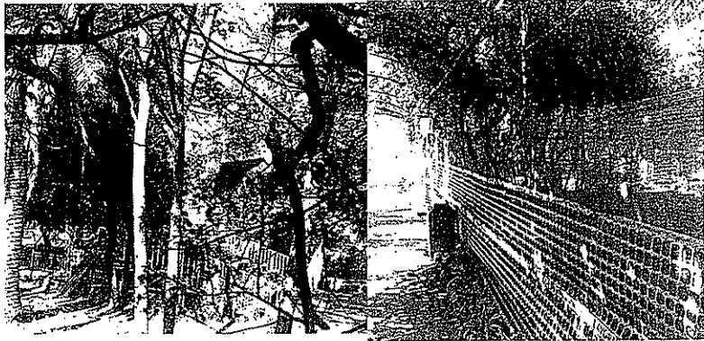
San Giorgio a Cremano. Lavori di restyling al via a Villa Bruno. Finanziamento da 1 milione e mezzo

«Il restyling di Villa Bruno, patrimonio della città e monumento di inestimabile valore artistico - spiega il sindaco Giorgio Zinno - restituirà ai sangiorgesi un luogo che torna ad essere il simbolo di una città accogliente, vivibile ed inclusiva. Siamo certi che, con la valorizzazione del parco e delle aree della villa, oggetto di intervento, la villa diventerà sempre più punto di riferimento turistico-culturale dell'intero Miglio D'oro».