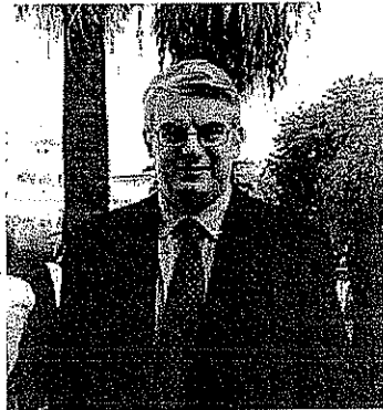
— Il sindaco Giorgio Zinno

«Per la prima volta pubblichiamo un avviso finalizzato a creare un elenco da cui attingere soggetti che vogliono impegnarsi in questo e in altri progetti - spiega il sindaco Giorgio Zinno. La sinergia tra pubblico e privato rappresenta una marcia in più per rispondere ai bisogni emergenti stando al fianco di persone che hanno bisogno di sostegno. Con le opportunità messe a disposizione e le risorse che abbiamo intercettato, ci impegniamo a demolire quelle dinamiche di esclusione e marginalizzazione soprattutto nei confronti dei "diversi" che premono