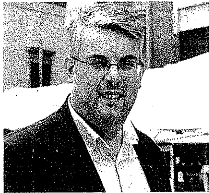
● — Il sindaco Giorgio Zinno

SAN GIORGIO A CREMANO. Massima attenzione da parte del sindaco Giorgio Zinno sulla tema della sicurezza in città. Da giovedì sera sono partiti posti di controllo e ronde nelle ore serali e notturne da parte della Polizia Municipale. Grazie all'impegno dell'Amministrazione ogni sera almeno otto agenti pattuglieranno la città, durante i fine settimana, da giugno a settembre supportando le attività che vengono svolte dalla Polizia di Stato e Carabinieri. La polizia municipale batterà a tapeto tutto il territorio, al fine di prevenire atti di illegalità e possibili episodi di criminalità che potrebbero verificarsi nelle ore successive alle 20. Con un coordinamento tra la centra-