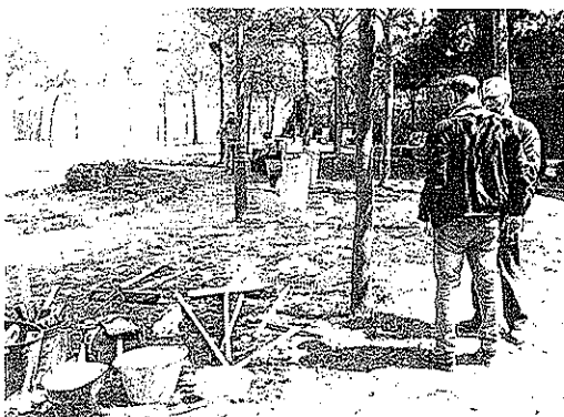
© -- Iniziate i lavori di restyling del Parco dell'Anima

POZZETTI E ARREDO URBANO. Inoltre, verranno messi