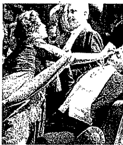
●— La Traviata al San Carlo