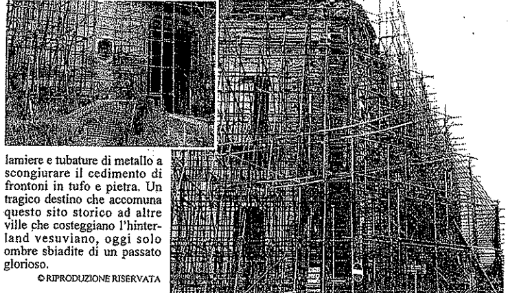
lamiere e tubature di metallo a scongiurare il cedimento di frontoni in tufo e pietra. Un tragico destino che accomuna questo sito storico ad altre ville che costeggiano l'hinterland vesuviano, oggi solo ombre sbiadite di un passato glorioso. © RIPRODUZIONE RISERVATA

ple e potrebbe non bastare lo sforzo congiunto del Comune di San Giorgio a Cremano e il braccio di ferro dei residenti. Di questo passo una semplice manutenzione potrebbe non bastare più ma per un restauro definitivo si parla di cifre astronomiche, impossibili da sostenere per il solo Comune vesuviano senza il contributo di altri enti. Al degrado in cui versa villa Pignatelli, un tempo motivo di vanto, si oppongono i residenti della zona che continuano a sollecitare interventi di restauro. Una riqualificazione di certo non semplice: della celebre location di 'Io speriamo che me la cavo', film cult del 1992, oggi non restano che