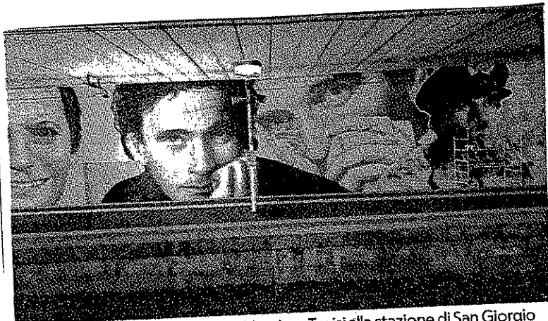
I murales di Alighiero Noschese e Massimo Troisi alla stazione di San Giorgio