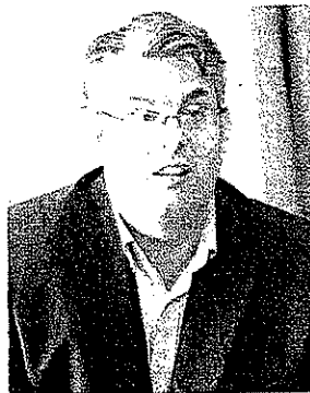
IL PRIMO CITTADINO Il sindaco Giorgio Zinno