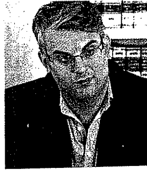
Il sindaco Giorgio Zinno